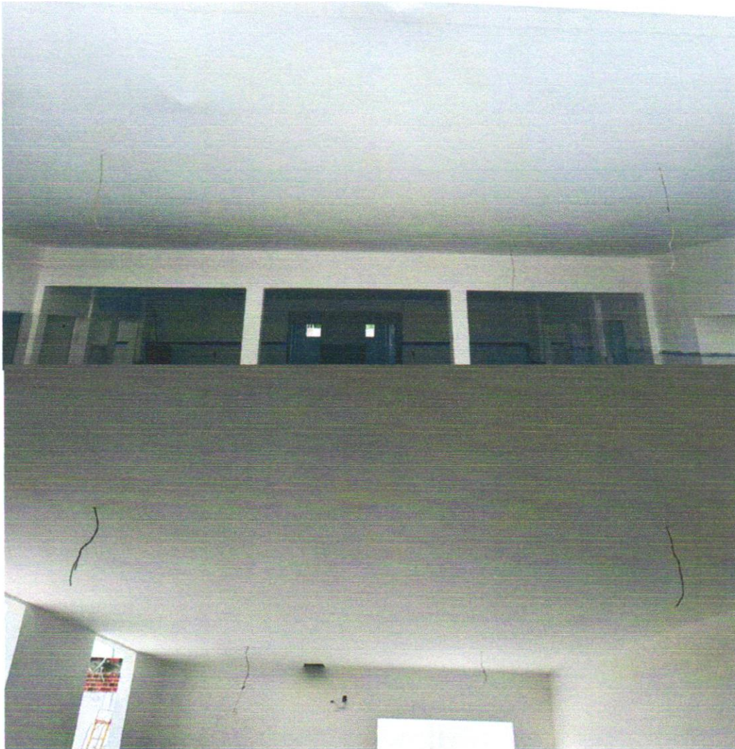
3) EXECUÇÃO ESTRUTURA DA MINI QUADRA